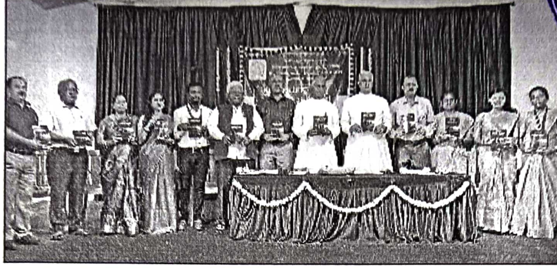
ಕಲಘಟಗಿ ಗುಡ್ ನ್ಯೂಸ್ ಕಾಲೇಜಿನಲ್ಲಿ ಕೃತಿಗಳ ಬಿಡುಗಡೆ ಕಾರ್ಯಕ್ರಮ ನಡೆಯಿತು.